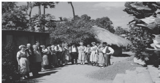
Souvenir de Guinée

Les danses, qui allieront chorégraphies traditionnelles et plus originales, seront accompagnées par un orchestre de cinq musiciens.