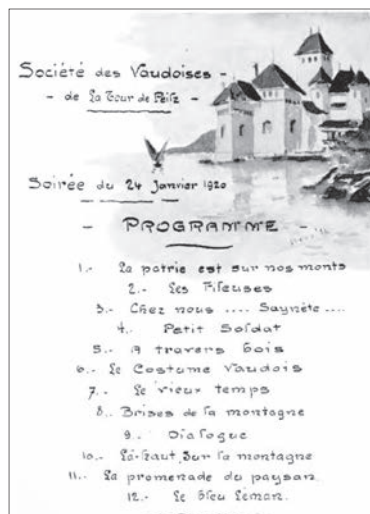
Programme du 1er spectacle en 1920

2019. Un homme se réveille dans le hall de l'Hôtel des Vignerons, à La Tour-de-Peilz et aperçoit, sur une étagère, une vieille chaussette en laine. Le même jour, les danseurs et chanteurs des Vegnolan débarquent en costume vaudois dans cet hôtel pour préparer un spectacle.