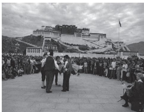
et au Tibet