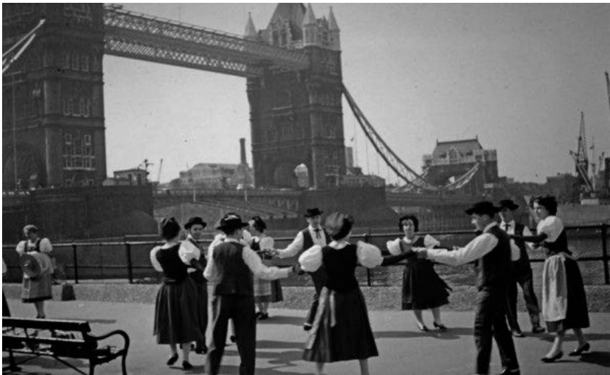
Lè Vègnolan à Londres en 1963

Messenger de l'Association cantonale du costume vaudois