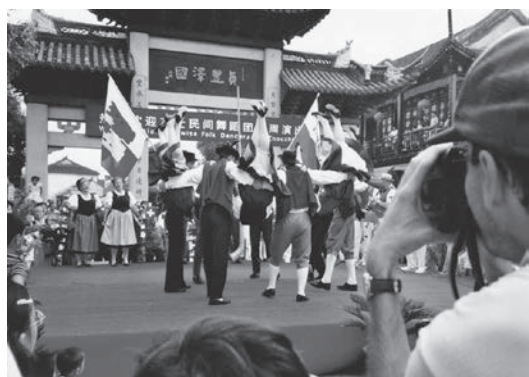
Lè Vegnolan en Chine

ou par téléphone au 021 943 16 68, les matins des jours ouvrables de 8h à 10h.