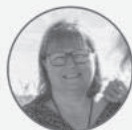
Ariane de Bourbon Parme