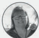
Ariane de Bourbon Parme